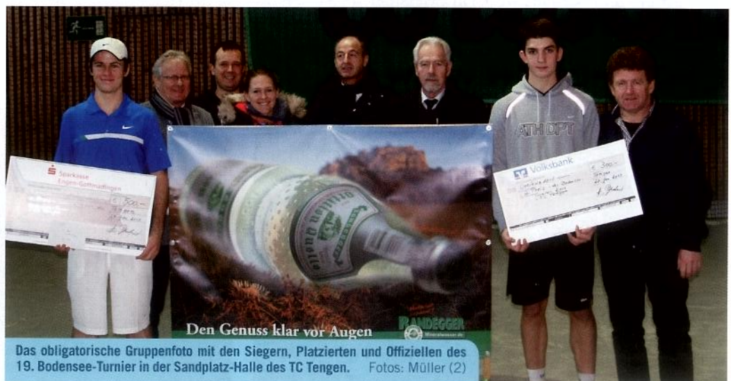
Das obligatorische Gruppenfoto mit den Siegern, Platzierten und Offiziellen des 19. Bodensee-Turnier in der Sandplatz-Halle des TC Tengen.

Entscheidung bringen. Hier hatte der an sieben gesetzte Rheinfeldener mit 10:4 die Nase vorn. Ebenfalls ganz